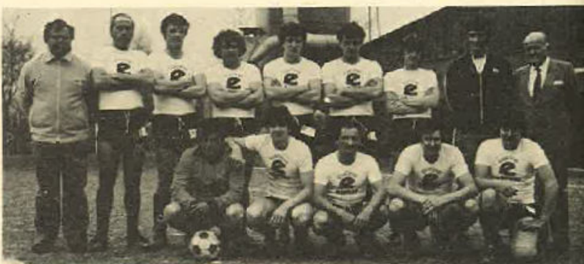
La squadra del Gruppo Alpini di Roncade.

neo, che, dopo alterne vicende, si risolse a Treviso con la disputa della finale allo Stadio Comunale Tenni.