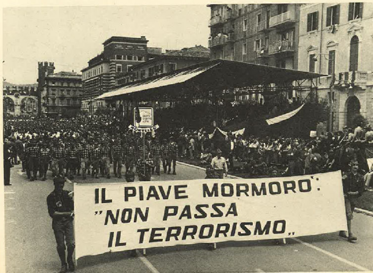
Con questo striscione, la Sezione di Treviso riconferma la sua fedeltà ai valori della libertà e della democrazia.

Precedeva il grosso della Sezione, uno striscione con un messaggio incisivo ed esaltante, che riflette l'attuale triste momento in cui è coinvolta la nostra Italia: «Il Piave mormorò, non passa il terrorismo». E' questa l'eco struggente che proviene dalla voce dei valorosi combattenti del Piave, che nel lontano 1917, dissero «non passa lo straniero» ed ottennero da questa convinzione la decisiva vittoria. Questa è oggi la voce di tutti i nostri Alpini, che ereditando l'espressa volontà di pace dei combattenti e dei caduti del Piave, affermano con la fede di coloro che credono alle libere istituzioni; «non passa il