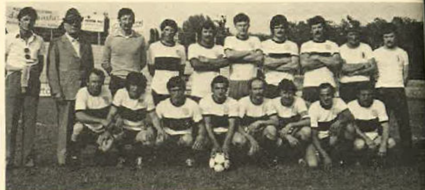
La squadra del Gruppo Alpini di Paese.

La passione e l'impegno dimostrati dai partecipanti meritano che l'iniziativa continui ed è augurabile che si cominci subito ad organizzarsi per il Torneo del 1982.