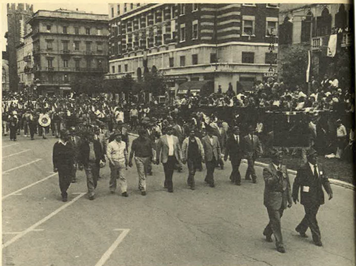
Sfila la nostra Sezione con oltre 4.000 soci.

L'impegno di questa indimenticabile giornata, è per tutti racchiuso in queste parole: «Bisogna andare avanti». Assieme ai nostri Labari, alle nostre Bandiere, ai nostri Gagliardetti, ai nostri Striscioni, alle nostre Medaglie d'Oro, ai nostri Generali, ai nostri Colonelli, a tutti i nostri Alpini, senza distinzione di grado o rango, hanno marciato i figli spirituali di Giuseppe Domenico Perrucchetti, gli eredi di Antonione Cantore, i compagni di Cesare Battisti. A testimoniare l'amore per gli Alpini sono presenti le madri, le vedove e le sorelle di quelli che diventarono «Centomila Gavette di Ghiaccio», o che sono rimasti sulle ambe e negli uadi. Colpisce il cuore lo sguardo degli orfani fatti uomini, che incontra quello dei reduci, anche delle altre armi, con i quali i padri divi-